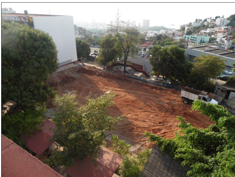
Imagen 4. U.A. Enfermería Acapulco, Juárez, Gro.

En atención a lo antes expuesto, se planteó la creación del programa Educación con Inclusión para Personas con Discapacidad que tiene su fundamento jurídico en la Ley General para la Inclusión de las Personas con Discapacidad; Ley para el Bienestar e Incorporación Social de las