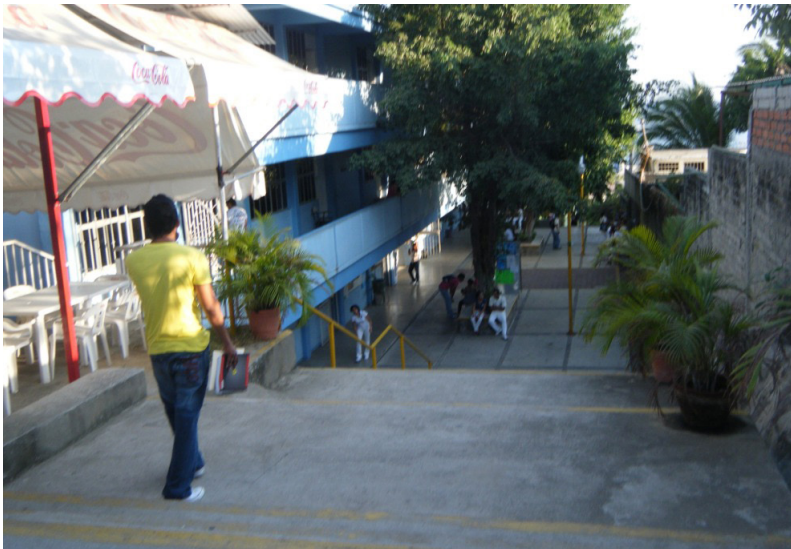
Imagen 1. U.A. de Psicología, Acapulco de Juárez, Gro.

En el diagnóstico que se realizó en el ciclo escolar 2014–2015, se encontró que del total de la matrícula escolar, apenas se está atendiendo