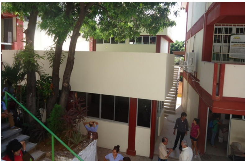
Imagen 2. U.A. de Sociología, Acapulco de Juárez, Gro.