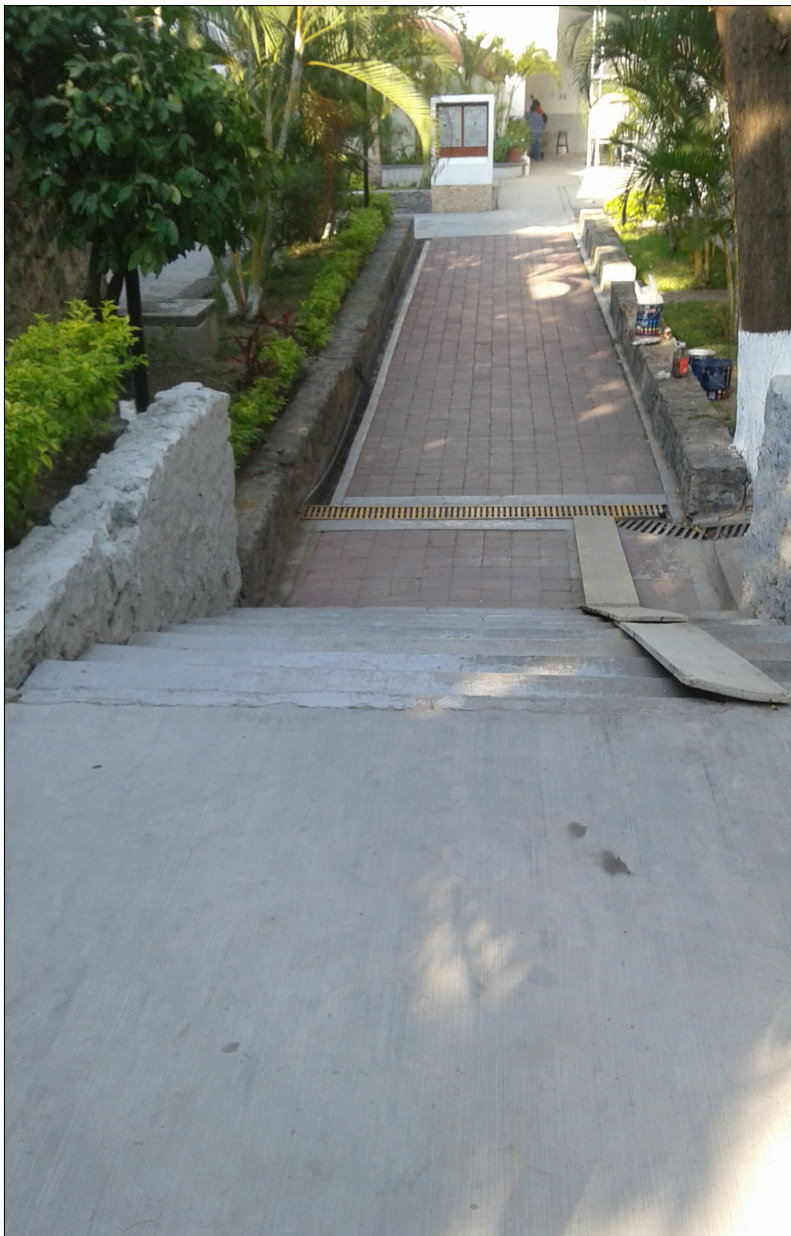
Imagen 3. U.A.Gro., Acapulco de Juárez, Gro.